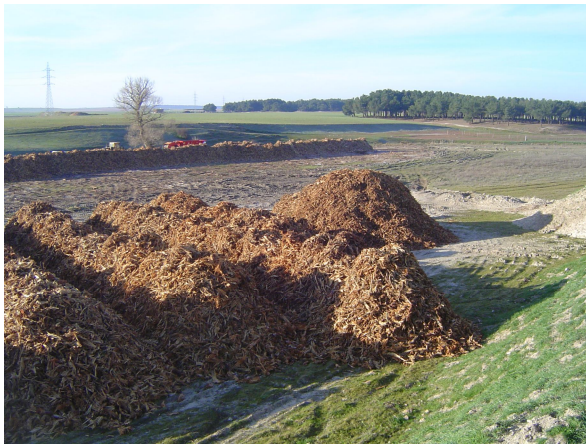
Detalle de apilado

El resultado de esta pre-trituración, es una asombrosa reducción de volumen, y un producto de mayor facilidad de manejo y transporte.