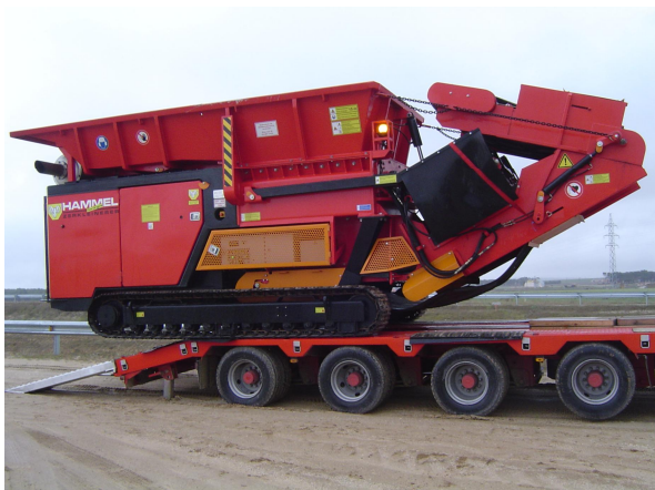
La máquina se transporta sobre góndola y dispone de su propio sistema de tracción

Con el fin de conseguir un sistema de producción ágil y dinámico, que incluso permita acercar el reciclaje a los puntos donde se encuentran los restos, AECO S.A. dispone de maquinaria móvil de gran potencia adecuada para el tratamiento de grandes elementos y volúmenes.