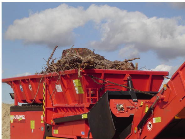
La tolva, de gran capacidad, admite tocones de gran volumen

Este es el caso de la pre-trituradora Hammel 750 . Esta pre-trituradora de velocidad lenta trabaja con dos rotores que no giran a más de 47 rpm, aplicándose toda la potencia de sus 350 C.V. en destrozarse el material aportado. Por esta razón podemos hacernos cargo de triturar casi cualquier tipo de material, desde simples residuos verdes de poda o maleza, o madera de desecho, hasta traviesas de ferrocarril, o tocones recién extraídos.