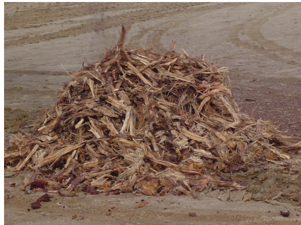
Detalle del pre-triturado obtenido