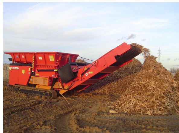
La cinta transportadora permite crear pilas de astillas de 3 metros de altura o cargar directamente en contenedor